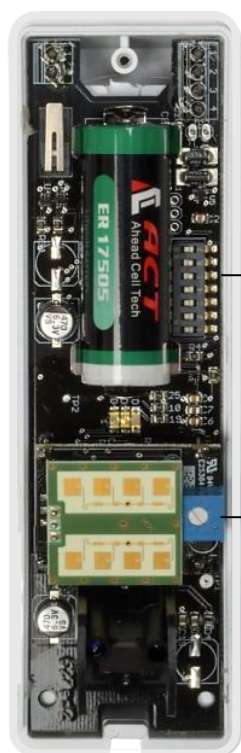
SMART WS DT

SMART WS DT è un sensore a doppia tecnologia per porte e finestre. Particolarmente resistente agli agenti atmosferici, ha dimensioni ridotte, che lo rendono adatto alla protezione di spazi ben definiti e ristretti. SMART WS DT crea una barriera a tenda ultra ridotta di circa 7,5 gradi e ha una portata regolabile fino a 9 m. Grazie all'utilizzo di una batteria al litio da 3,6 Vdc / 3,2 Ah, il rivelatore SMART WS DT conferisce una notevole autonomia. Disponibile nei colori bianco e marrone, ha la staffa di fissaggio inclusa nella confezione.