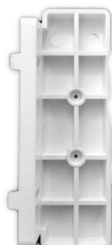
STAFFA LATERALE (DI SERIE)